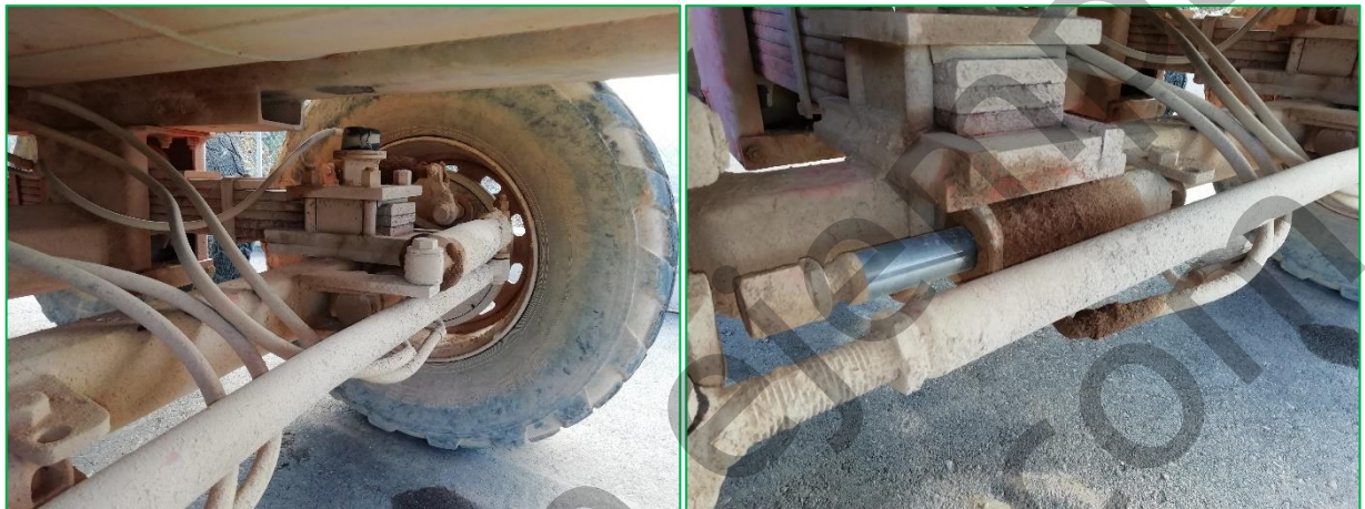
Topes de Goma Ballestas